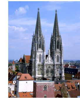
Frontansicht des Regensburger Doms