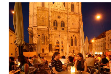
Blick über die Außenterrasse am Haus Heuport auf die Domfront