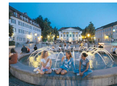
Beschauliche Abendszene am Regensburger Bismarckplatz